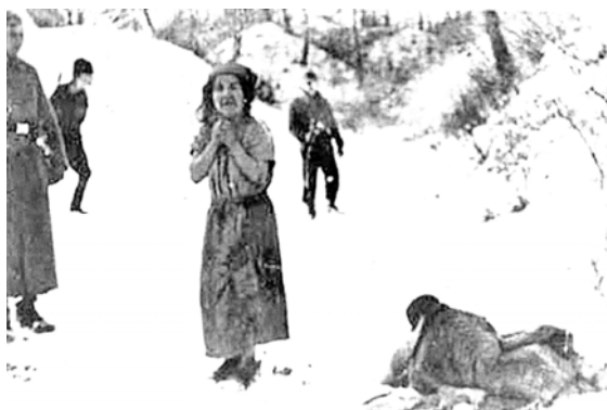
Cigányok kivégzése a románok által megszállt szovjet területen