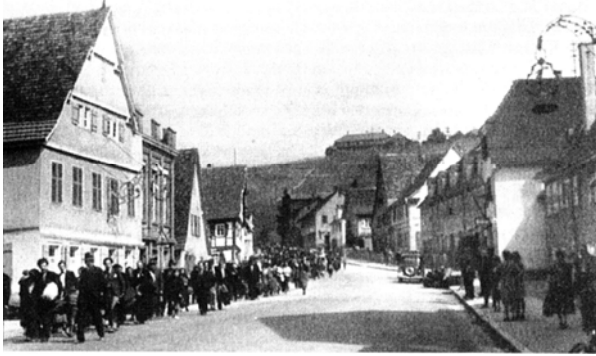
Németországi romák deportálása a koncentrációs táborokba