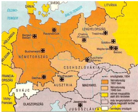
A leghírhedtebb koncentrációs és megsemmisítő táborok 2