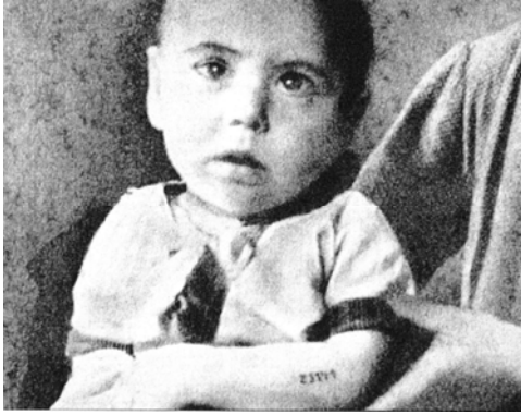
A Z3141-es számú auschwitzi fogoly –Hol valósították meg a magyar szolgabíró ötletét?