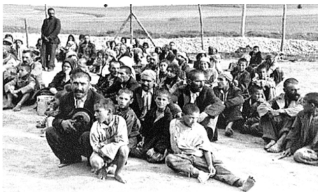
Cigányok csoportja egy koncentrációs táborban