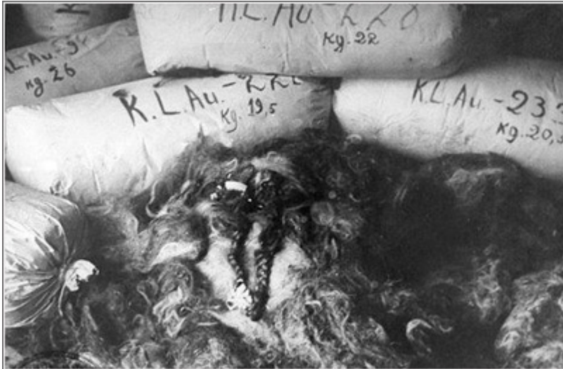
Összegyűjtött női haj Auschwitzban –Mit jelentenek ezek a „gyűjtemények”?