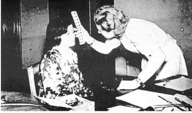
„Fajkutató” egy nő szemének színét vizsgálja