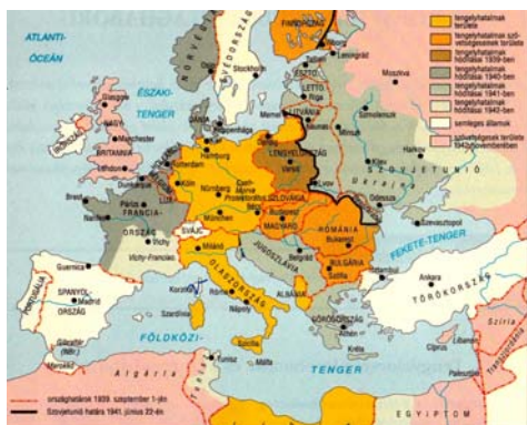
A második világháború Európában, 1939 szeptembere – 1942 novemberéig 1