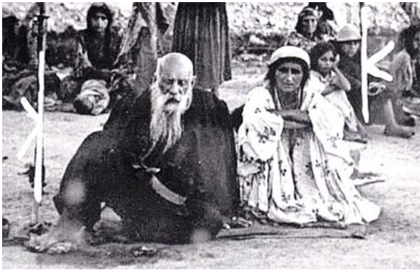
Deportált romániai cigányok