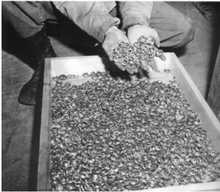
Amerikai katonák a Buchenwaldban talált sokezer karikagyűrű egy részével