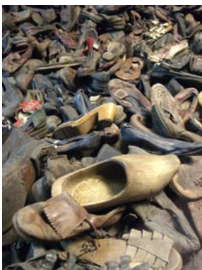
Cipők az auschwitzi kiállításon