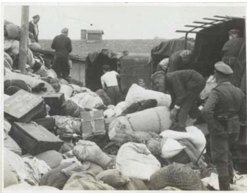
Elgázósított áldozatok holmijának válogatása Auschwitzban