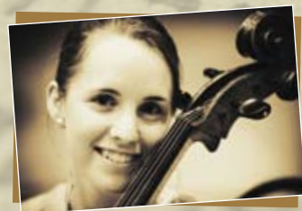
Rohmann Ditta gordonka