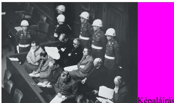
Képaláírás: Baldur von Schirach a nürnbergi per során, 1945/46, második sor közepe, világos öltönyben