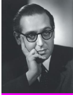
Képalírás: Georg Kreisler, Bécs 1956