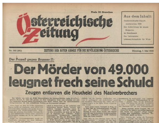
Képaláírás: Anton Brunnert, a Bécsből indított deportációs

konvojok szervezésének egyik fő felelősét 1946 májusában népbíróság elé állítják Bécsben, halálra ítélik és kivégzik. A bécsi illetőségű „Zsidó Kivándorlás Központi Hivatalának”, a deportálások leglényegesebb szervének legtöbb tettesét azonban nem vonják felelősségre. Österreichische Zeitung (Osztrák Újság), 1946.5.7.