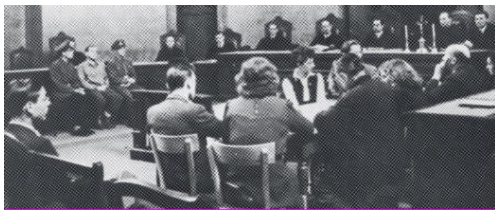
Képaláírás: a vádirat felolvasása Anton

konvojok szervezésének egyik fő felelősét 1946 májusában népbíróság elé állítják Bécsben, halálra ítélik és kivégzik. A bécsi illetőségű „Zsidó Kivándorlás Központi Hivatalának”, a deportálások leglényegesebb szervének legtöbb tettesét azonban nem vonják felelősségre. Österreichische Zeitung (Osztrák Újság), 1946.5.7.