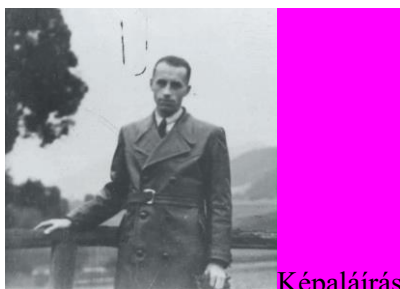
Képaláírás: Alois Brunner, a bécsi „Zsidó Kivándorlás Központi Hivatalának” vezetője, a kép 1943-ban készült, valószínűleg a Semmeringnél