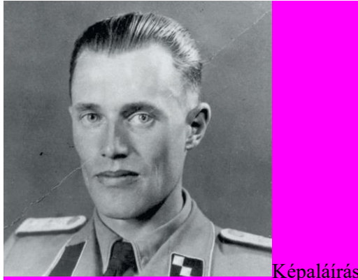
Képalírás: Franz Novak SD-egyenruhában (Sicherheitsdienst), dátum nélküli

illetve nagyon enyhe büntetésekkel végződnek az eljárások. Az osztrák igazságszolgáltatás kudarcának egyik legszembetűnőbb példája a Franz Novak (1913-1983) elleni per. Novak a bécsi „Központi Hivatal” munkatársaként kezdte pályafutását, később a berlini RSHA-nál a deportációs konvojok logisztikájáért felelt. A háború után Novak Ausztriában bujdosott. 1961-ben letartóztatják, majd állítólagos parancsteljesítési kötelezettségre hivatkozva átmenetileg szabadlábra helyezik. 1972-ben újabb eljárás keretében hét év fegyházra ítélik. Az előzetes letartóztatásban töltött öt év beszámítását követően a letöltendő börtönbüntetésének fennmaradó részét végül elengedi a köztársasági elnök.