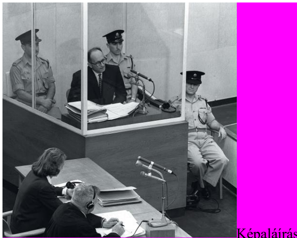
Képalírás: Adolf Eichmann a védelem kihallgatása alatt, a jeruzsálemi kerületi bíróságon, 1961. június 21-én