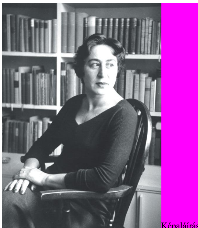
Képaláírás: Hilde Spiel, Bécs 1955.

Georg Kreisler a: Die heiße Viertelstunde (A forró negyedóra) c. ORF-műsorban, 1968.6.2.