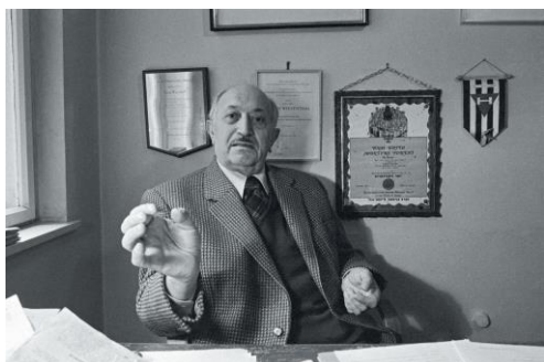
Simon Wiesenthal a Náci Rezsim Által Üldözöttek Osztrák Dokumentációs Központjában található irodájában, Salztorgasse 6, Bécs 1970